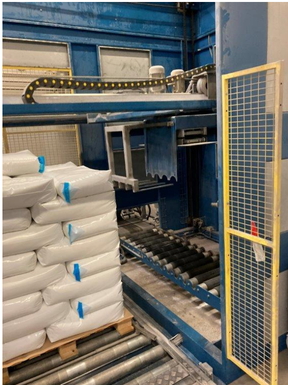
Pelletiseermachine in werking