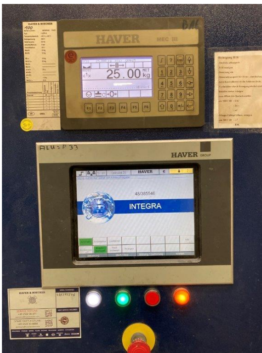
Controle-unit voor het instellen van vulgewicht