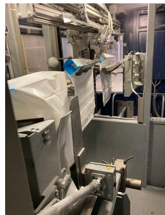
Vul-unit in werking