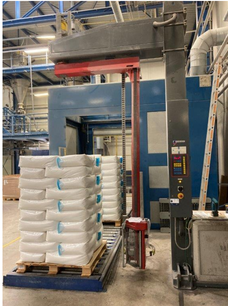
Wikkelmachine draait automatisch rondom de pallet