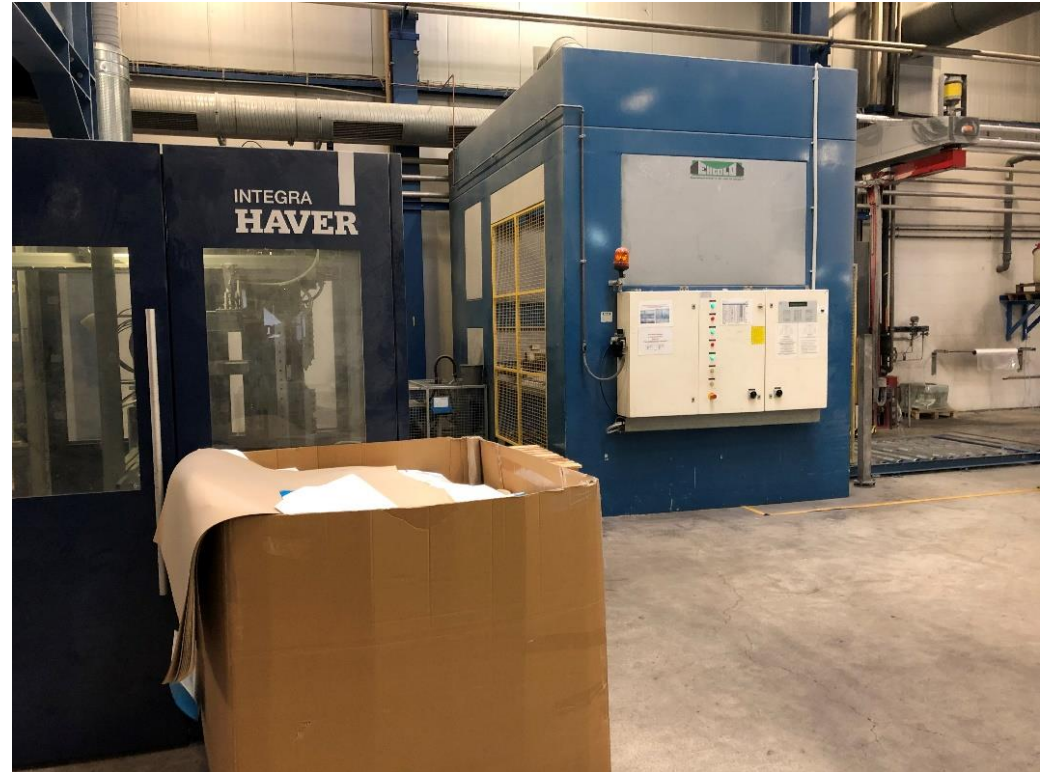
Vulunit en palletiseermachine verbonden met een roltransportsysteem