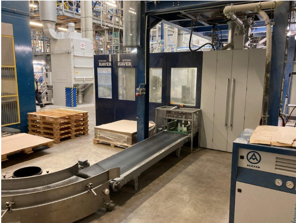
Eindproduct wordt afgevuld in ventielzakken