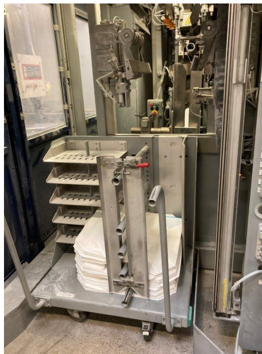
Zakmagazijn (handmatig vullen)